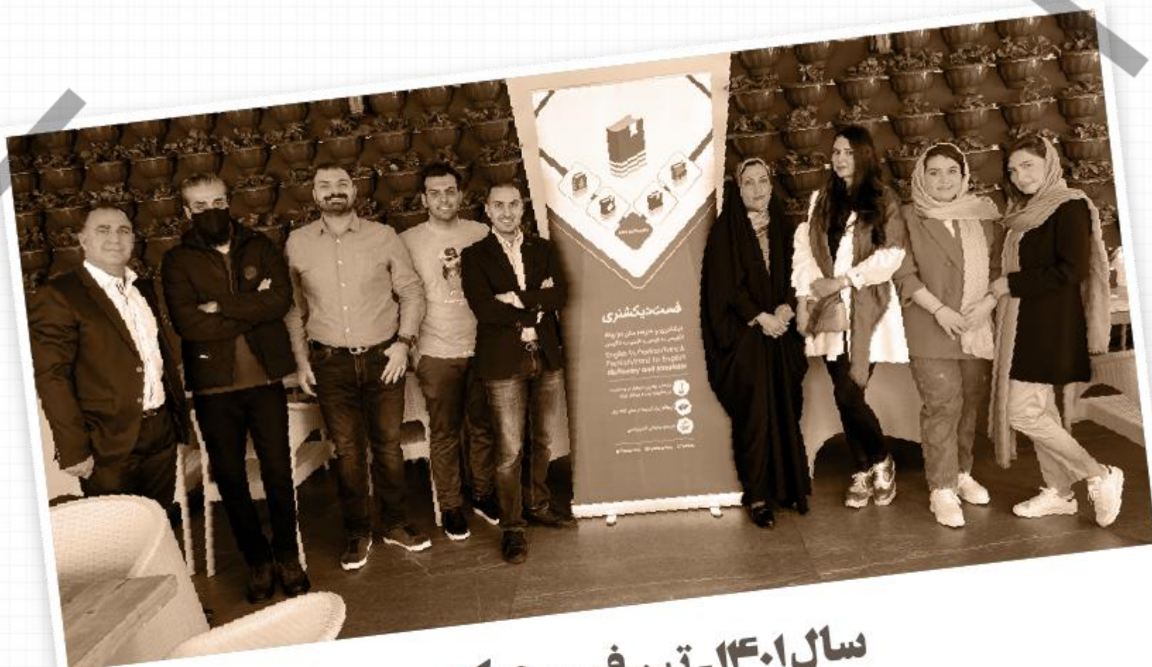
سال ۱۴۰۱ - تیم فست دیکشنری